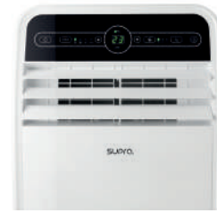
Panneau de commande tactile Touch control panel