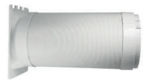
Tuyau d'évacuation Drainpipe