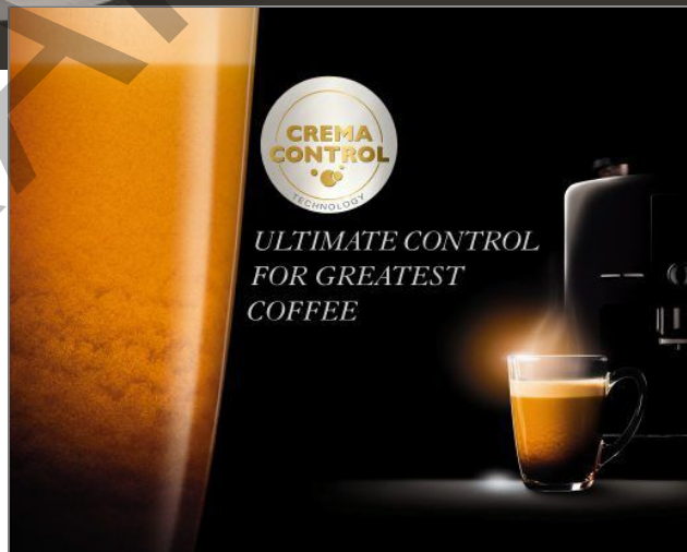
ESSENTIAL DISPLAY CAPPUCINO EA816031

L'essence même de l'espresso, directement dans votre tasse avec la machine Arabica.