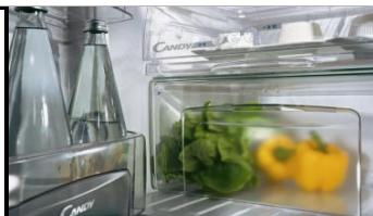
TABLE TOP CCTOS 502 WH